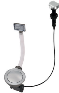
Automatischer Abfluss Space - PE 8407 109