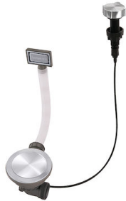
Automatischer Abfluss Space Milano 8407 115