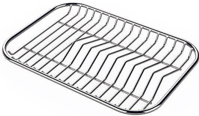
Tellerständer aus Edelstahl 8100 154