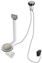
Automatischer Abfluss Space Light - PL 8407 117