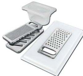
Satz Reibe mit Halterung für Ring und Auffangschale 8159 101 * nur in Kombination mit dem Zubehör 8644 101