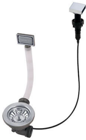
Automatischer Abfluss - PM 8407 113